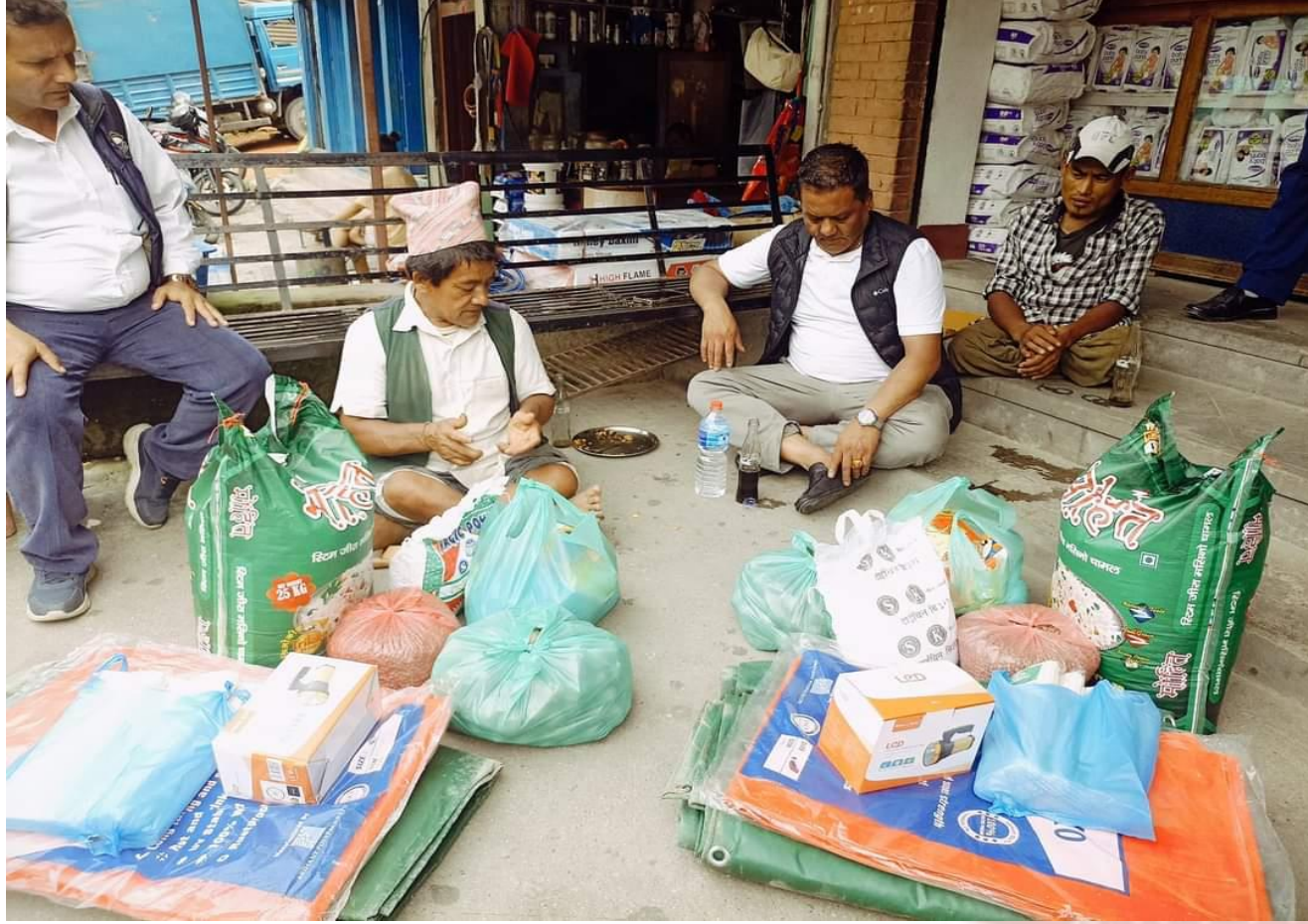
अपांगता व्यक्तिलाई रासन सहित आर्थिक सहयोग गर्नुहुदै नगरप्रमुख