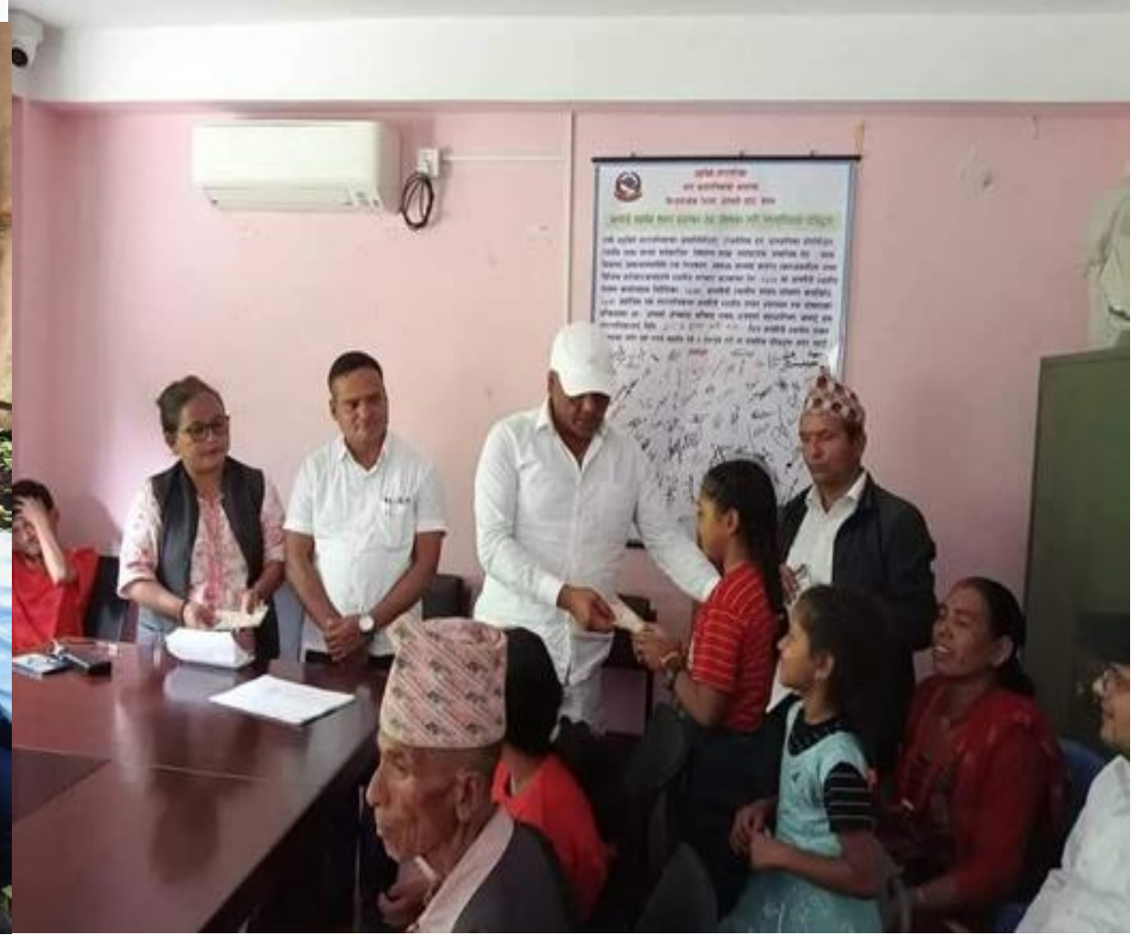
बाबु आमा विहिन बालबालिका लाई शिक्षामा सहयोग कार्यक्रम