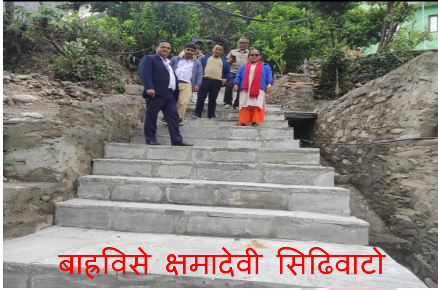
बाह्रविसे क्षमादेवी सिढिवाटो