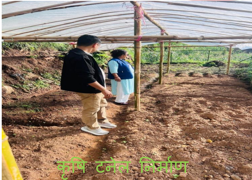
कृषि टनेल निर्माण