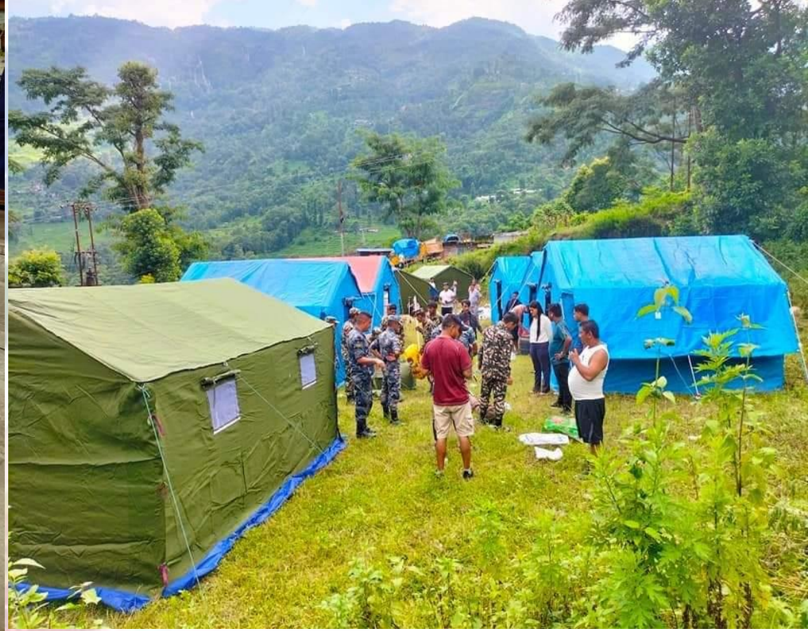
विपद पश्चात सुरक्षित स्थानमा सार्दै नागरिकलाई