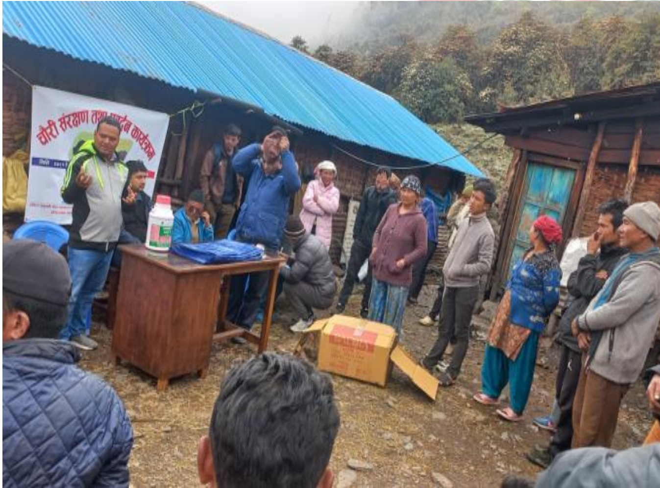
चौरीपादन का लागि समुदाय संग परामर्ष