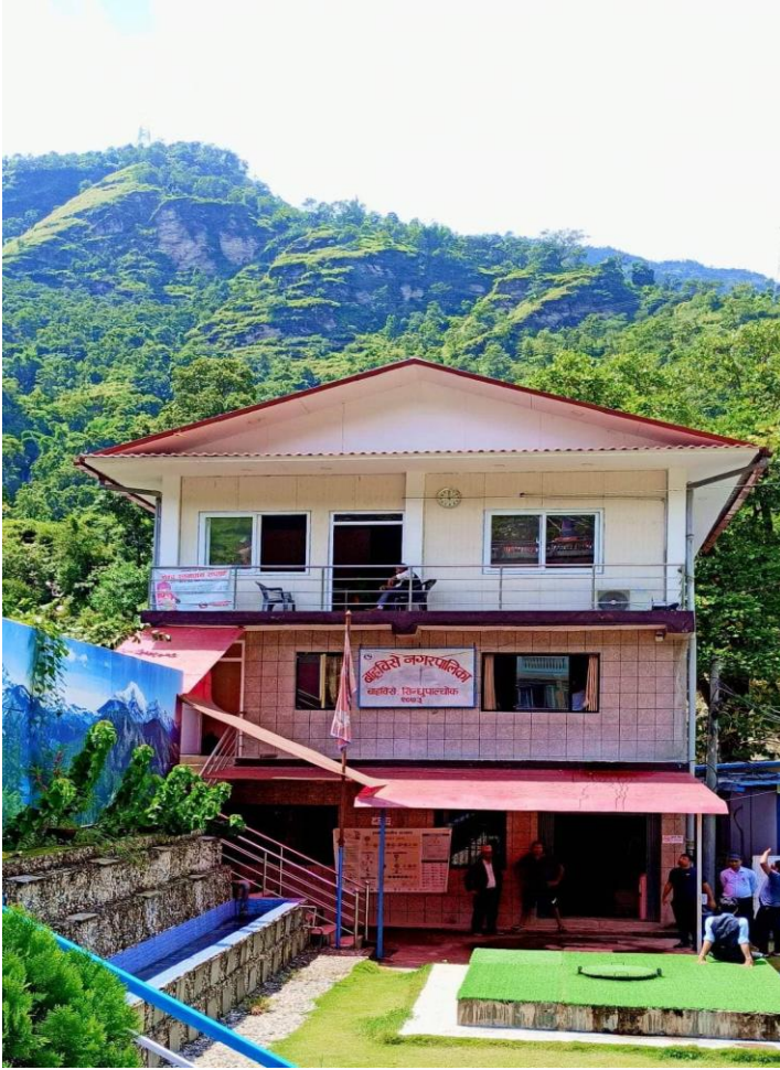
बाहबिसे नगरपालिका भवन