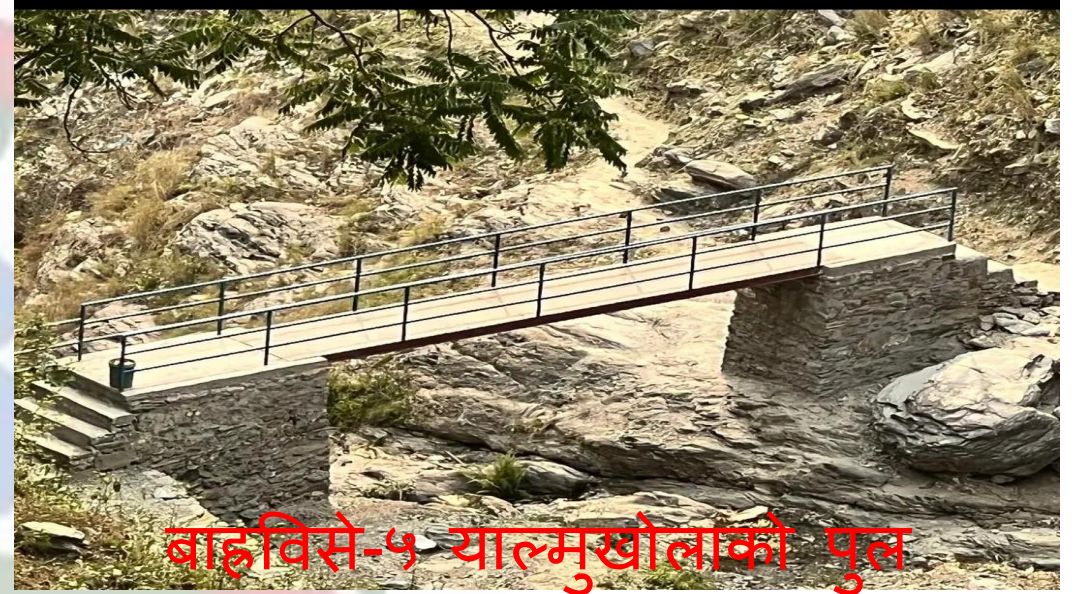
बाह्रविसे-५ याल्मुखोलाको पुल