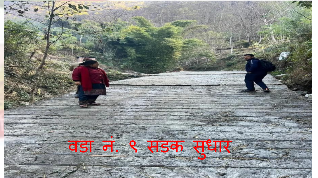
वडा नं. ९ सडक सुधार