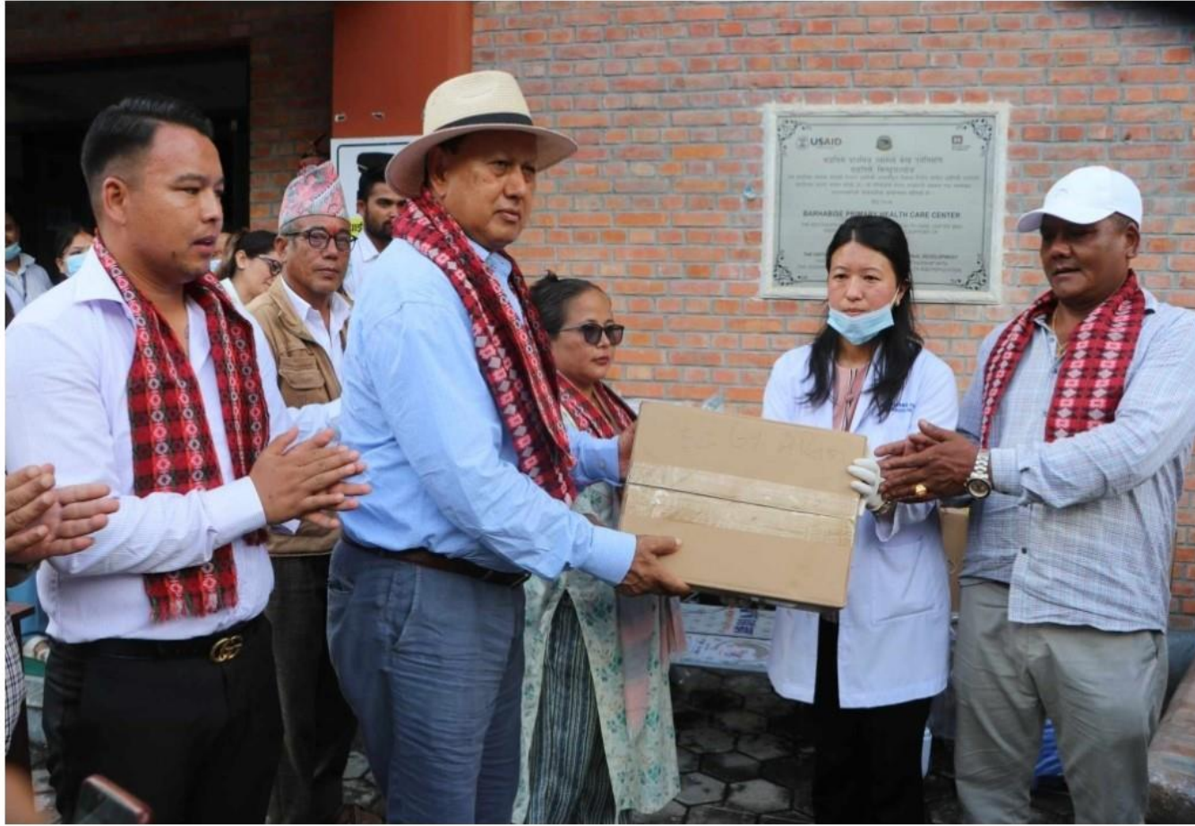
स्वास्थ्य सामाग्री हर्तान्तरण