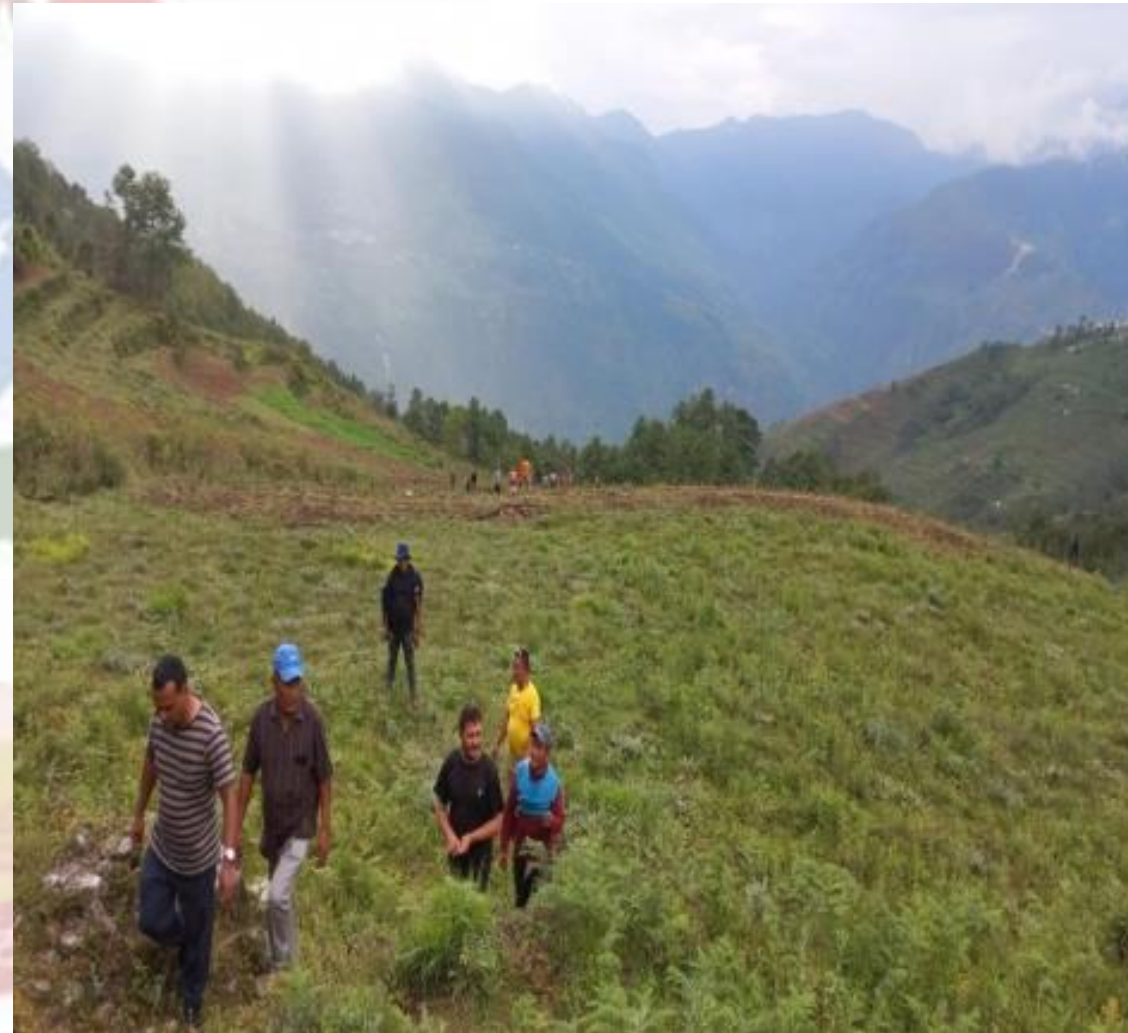
वन्दै गरेको चिया बगान । पकेट विस्तार बा.न.