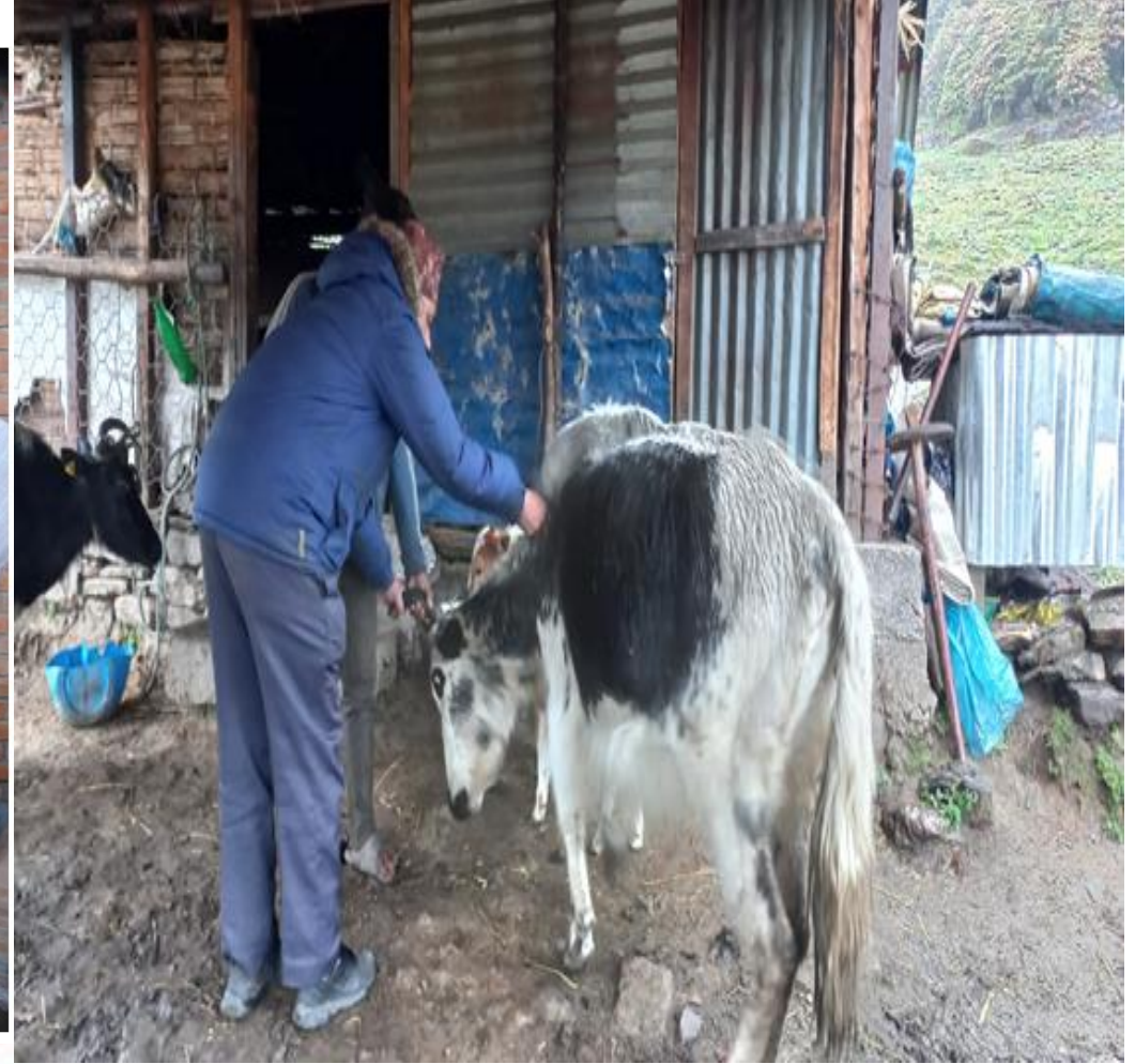
चौरीलाई लम्फी खोप लगाउदै